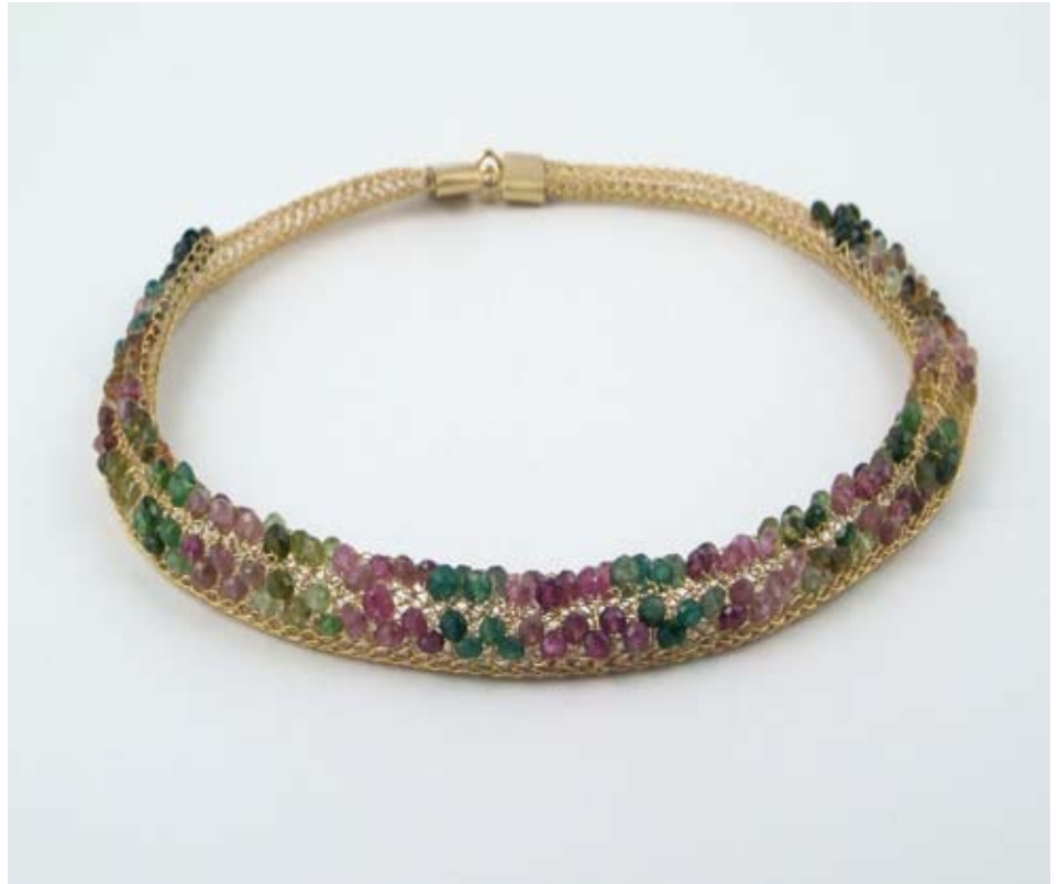
Handgefertigte Strickgeflechte in hochwertiger Ausführung: klassisch in Gold und Platin experimentell mit Glas, Zuchtperlen und Edelsteinen.