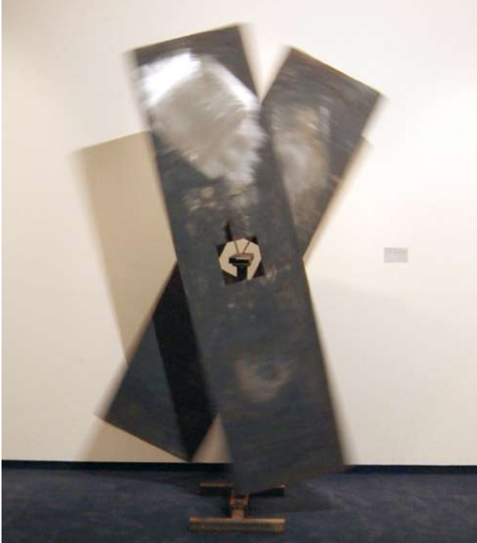
STAHLHALBZEUG auf Schrottplätzen gefunden, geschweißt und verschraubt; Oberfläche meist offen und rostend.